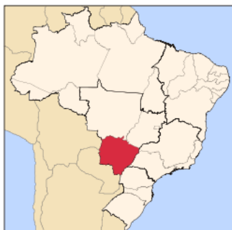
Figura 1: Localização de Mato Grosso do Sul

Sua capital é a cidade de Campo Grande e outros municípios economicamente importantes são Dourados, Três Lagoas, Corumbá, Ponta Porã, Aquidauana, Nova Andradina e Naviraí.