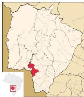
Figura 2. Localização do município Ponta Porã/MS

Ponta Porã está situada na Serra de Amambai, que é uma continuidade da Serra de Maracaju. Apresenta uma topografia plana e levemente ondulada, sendo o ponto culminante a Serra de Maracaju, iniciando a elevação máxima no distrito do Apa a 850 metros acima do nível do mar. Tem em sua vegetação a predominância dos campos limpos como característica do município, formado por grandes áreas de gramíneas rasteiras, constituindo as famosas pastagens naturais. O solo da região classificado como Latossolo vermelho escuro com predominância de latossolo roxo, em suas imediações.