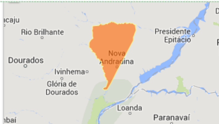
Figura 1. Localização de Nova Andradina no Estado de Mato Grosso do Sul.

Com 45 mil habitantes e 477 mil hectares de área, Nova Andradina é conhecida como a “Capital do Vale do Ivinhema”, região esta que abrange os municípios de Anaurilândia, Angélica, Bataguassu, Batayporã, Ivinhema, Novo Horizonte do Sul e Taquarussu. A economia dessa região é lastrada principalmente na pecuária de corte, cana-de-açúcar, mandioca e atualmente, pela expansão da cultura da soja em áreas anteriormente ocupadas por pastagens degradadas. Dessa forma, no município de Nova Andradina, estabeleceram-se nos últimos anos cooperativas agrícolas como a COOPERGRÃOS, COOPAVIL, CANDÁ, COCAMAR E COPASUL, além de várias revendas de setor agropecuário. Estimativas locais indicam que na safra 2015/16, estima-se que a área ocupada com soja nesta região, foi de 50 mil hectares, sendo que a expectativa para a safra 2016/17 é de 20% em relação à safra anterior.