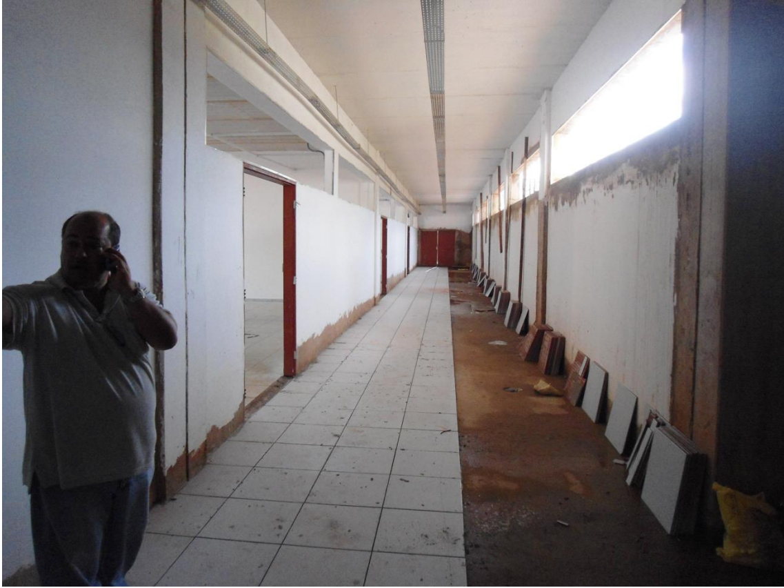
Data das fotos: 23.04.2014